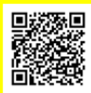
COCOA (Google Play)