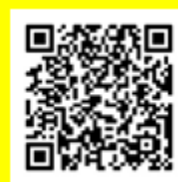
パーソナルサポート